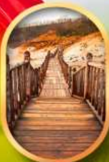
หุบเขาจิกอกุคานิ