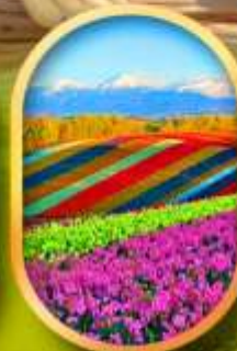
สวนดอกไม้ชิชิโซ