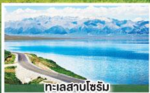
ทะเลสาบไซรัม