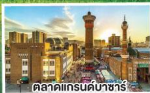
ตลาดแกรนด์บาซาร์