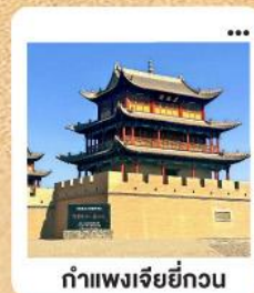
กำแพงเจียชี่กวน