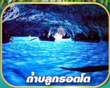
ถ้ำบลูกรอดโก