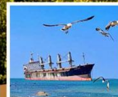
เรือสินค้าเกย์ตันบลูอิส