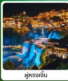
ฟู่หลงเจิ้น