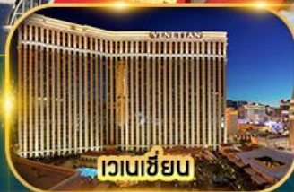
เวเนเซียน