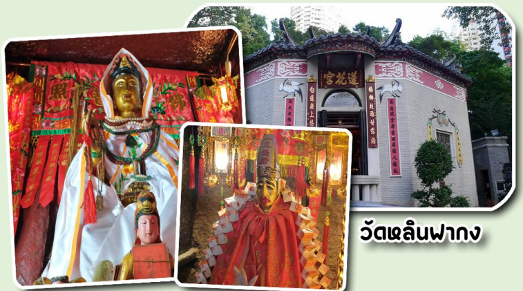
วัดหลินฟา

(Lin Fa Kung Temple) หรือ วัดดอกบัว เป็นวัดที่อยู่บริเวณหว่านจ่าย ทางทิศตะวันออกเฉียงเหนือของคอสมเวย์เบย์ โดยวัดนี้จะถูกก่อสร้างในช่วงราชวงศ์ชิง หรือ ปี ค.ศ. 1963 มีการบูรณะอีกครั้งในปี ค.ศ 1986 และ 1999 มีเจ้าแม่กวนอิมเป็นองค์ประธานของวัด โดยมีตำนานเล่าว่า เจ้าแม่