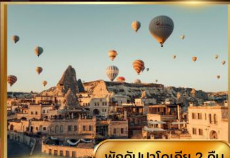
พักคัมปาโดเกีย 2 คืน