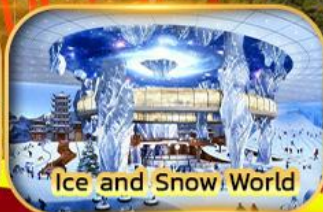
Ice and Snow World