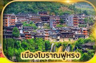
เมืองโบราณฟูหยง