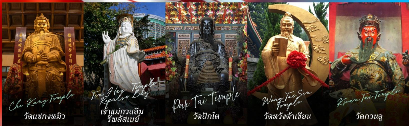
Che Kung Temple วัดแชกงทมิว

รายการทัวร์ข้างต้นอาจมีการปรับเปลี่ยนเพื่อความเหมาะสม