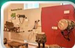
Museum of Folk Instrument