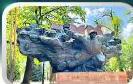
Panfilov Guardsmen Park