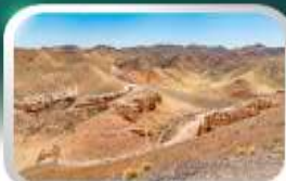
ชารินแกรนด์แคนยอน