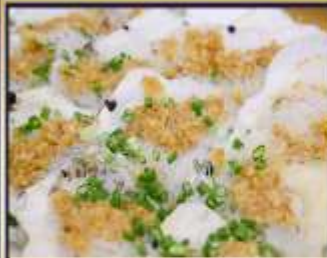
หอยเชลล์อบวุ้นเส้น