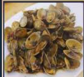
ผัดหอยลาย