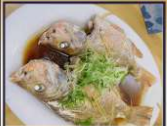
ปลาหนึ่งซีอิ๊ว