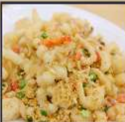
หมึกทอดกระเทียม