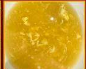
ซุ๊ปข้าวโพด