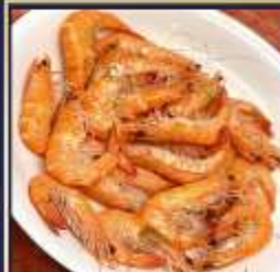
กุ้งหวานลวก