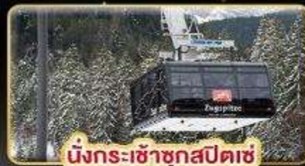
นั่งกระเช้าชุกสปีตซ์