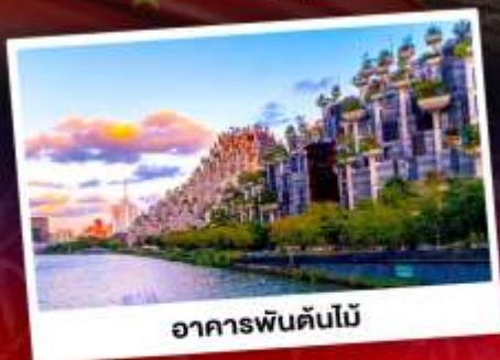
อาคารพินตันไม้

ชมการแสดงพลุสุดปังที่สวนสนุกดิสนีย์แลนด์