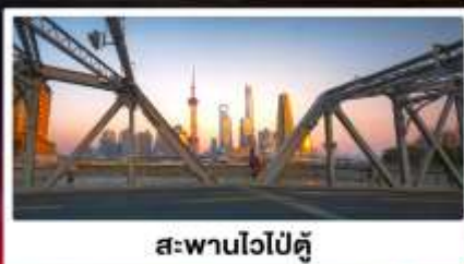
สะพานไวปู้ตู่