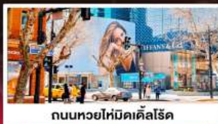
ถนนหยอไห่มีดเคิลโรด