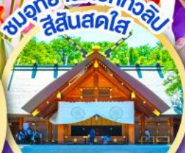
ชมอุทยานดอกทิวลิป สีแสนสดใส