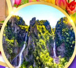
น้ำตกกิ่งกะ-น้ำตกริวเซ