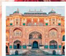
♥♥♥ Amber Fort