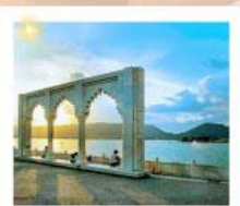
Ana Sagar Lake