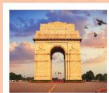
♥♥♥ India Gate