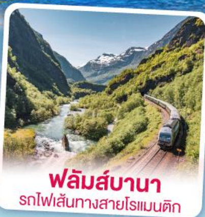
พลัมส์บานา รถไฟเส้นทางสายโรแมนติก