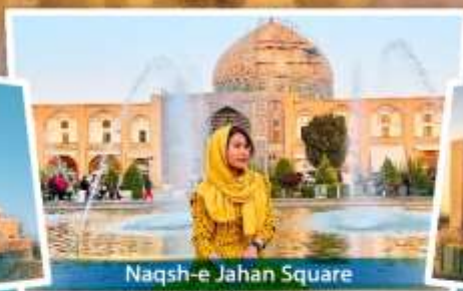
Naqsh-e Jahan Square